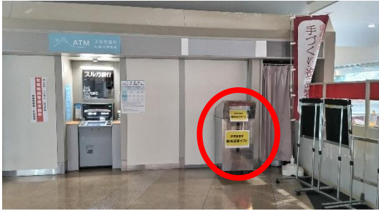
伊東市役所 1階 ATM コーナー