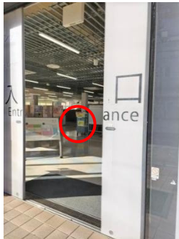
健康福祉センター 1階正面